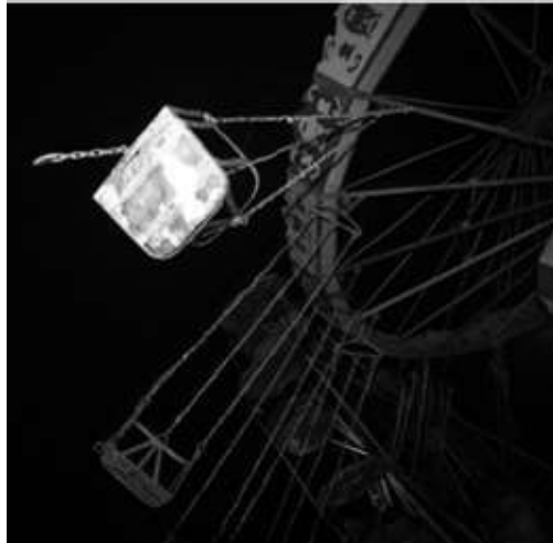
Tío vivo muerto.

Es más, esos artilugios producen toda una serie de efectos contraproducentes, que añaden más daños: individualismos recalcitrantes, narcisismos siempre urgentes y demandantes, victimismos, desplazamiento de toda responsabilidad al exterior, imposibilidad de agencia, libertad y ejercicio de la responsabilidad; idealización de las propias capacidades y potencias, culpabilizaciones, imposibilidad de aceptar la dificultad, la frustración o la impotencia; falta de escucha, de reconocimiento de la otredad; competitividad, irresponsabilidad en las tareas, condescendencia en la rendición de cuentas, conflictividades y dolores que se dejan abiertos, y que retroalimentan bucles de dolores y problemas; vigilancias y evaluaciones sumarias, intrigas internas, fragmentaciones y creación de